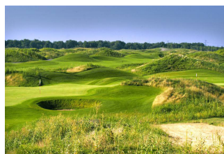
Parcours de l'Irlande